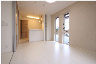
IHコンロ付き対面キッチン